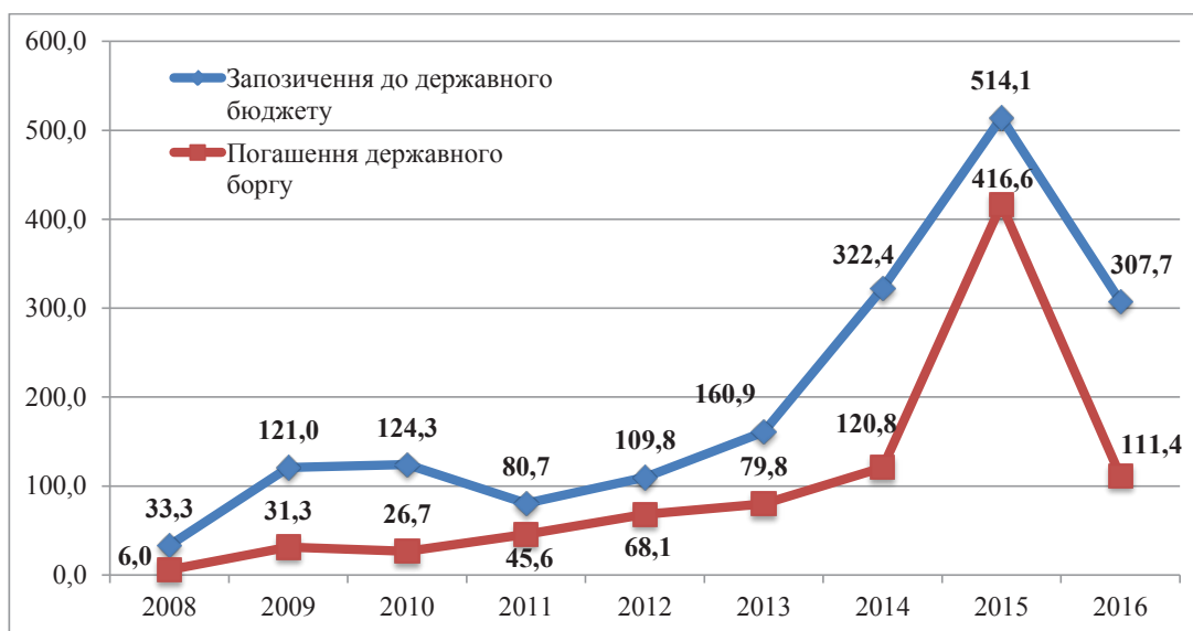
Рис. 3. Порівняння обсягів запозичень до державного бюджету та погашення державного боргу у 2008–2016 рр., млрд. грн.